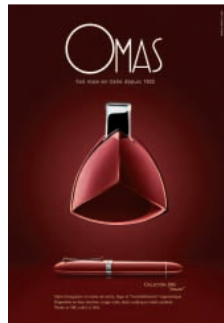
Conception campagne 2003-2004